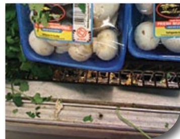
Microban protège les tablettes de fruits et légumes des taches, des odeurs et de la moisissure qui peuvent être causés par les environnements humides.