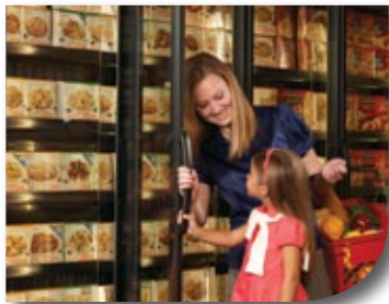
Poignées des portes de caissons d'étalage