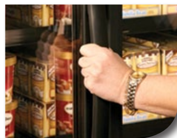
Microban protège les points où les clients mettent les mains comme les poignées des caissons pour qu'ils demeurent plus propres entre les nettoyages.