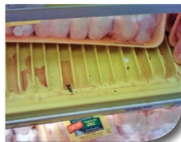
Microban protège les tablettes des odeurs et taches dues aux bactéries.