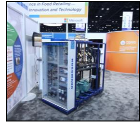
Système transcritique Purity au CO2 présenté dans le kiosque FMI de Hussmann.

Aucun système de réfrigération ne peut combler tous les besoins. Que vous visiez l'efficacité énergétique, la durabilité, la polyvalence ou le coût total de propriété, ou encore l'ensemble de ces facteurs, Hussmann peut vous aider à choisir la bonne solution pour vos besoins de réfrigération. Pour en savoir plus sur le portefeuille de produits de réfrigération Hussmann .