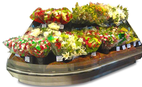
Comptoirs floraux Série Q réfrigérés, libre-service multi-étages

Pour combler les besoins de mise en marché de nos clients, Hussmann a ajouté deux nouveaux comptoirs floraux : Le comptoir Isla réfrigéré multi-étages et le comptoir floral Série Q réfrigéré libre-service multi-étages. Avec un intérieur noir qui met en relief les couleurs des fleurs, les comptoirs floraux Hussmann sont conçus pour un maximum de créativité. Les comptoirs Isla et Série Q offrent une gamme de produits pour la vente de fleurs et la planification. Les détaillants peuvent choisir des comptoirs droits ou en îlot, étroits ou profonds, des seaux flexibles et des comptoirs à étagères ou tablettes, ainsi que diverses options d'éclairage, y compris en auvent, suspendu et boom.