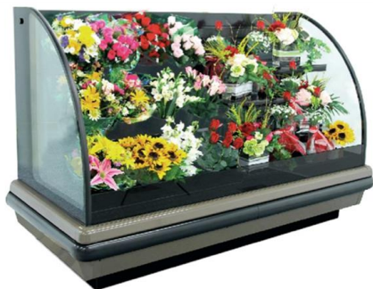
Comptoirs Isla réfrigérés multi-étages

Dans leurs efforts visant à démarquer de leurs concurrents, les détaillants alimentaires se tournent vers les secteurs créneaux et les spécialités, y compris les choix de fleurs. Selon un sondage mené en 2013 par le Food Marketing Institute, plus de 90 % des détaillants alimentaires offrent des fleurs et des plantes. Et bien que les départements floraux dans les épiceries représentent des achats plus impulsifs que les autres achats du magasin, ils peuvent permettre aux détaillants alimentaires de se démarquer.