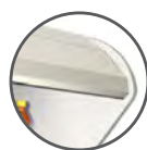
PAVILLON À facettes