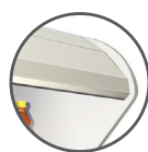
PAVILLON À facettes